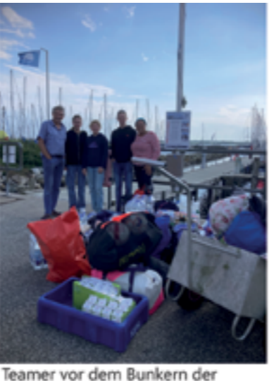
Teamer vor dem Bunkern der Lebensmittel in Maasholm