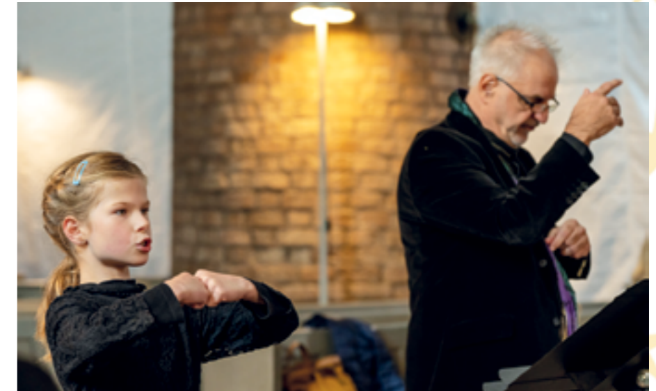
Mit Bewegungen geht alles leichter

Ton ins Publikum. Das hatte den Nebeneffekt, dass die Begeisterung übersprang. Es wippte mit den Füßen, schaukelte die kleinen Kinder, bewegte die Hände. Eine halbe Stunde vor der Aufführung gingen alle beruhigt in die Pause. Inzwischen füllte sich die Kirche. „Wie zu Weihnachten!“, dachten einige - etwa 700 Besucher mit vielen