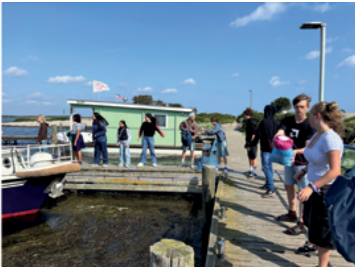
Konfirmandenzeit ist Teamwork