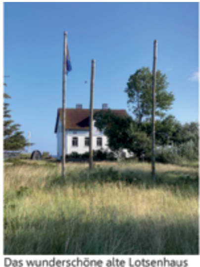
Das wunderschöne alte Lotsenhaus an der Mündung der Schlei