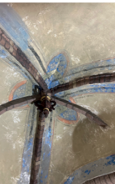
Viel Farbe: Das Strappo-Verfahren hat ansehnliche Malereien zutage gefördert

Alles ist allem ist es wie bei fast jeder Altbausanierung: Es entstehen neue Aufgaben und die brauchen Zeit. Der Abschluss des ersten Bauabschnitts wird entsprechend jetzt erst deutlich nach Ostern erfolgen.