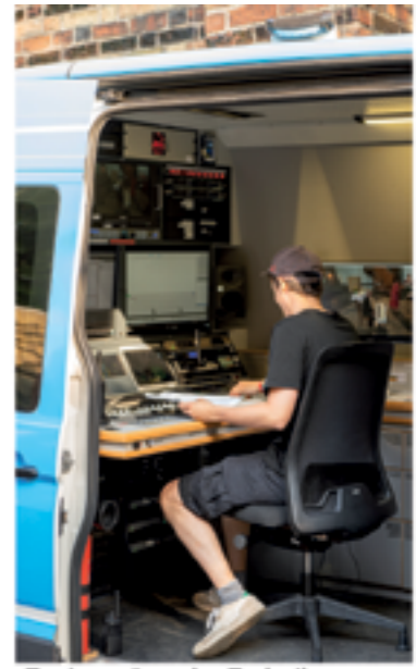
„Zauberer“ an der Technik