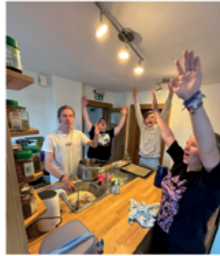
Kochen macht Laune