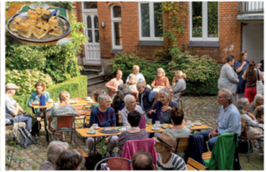
sommerlicher Nachklang im Pastoratsgarten