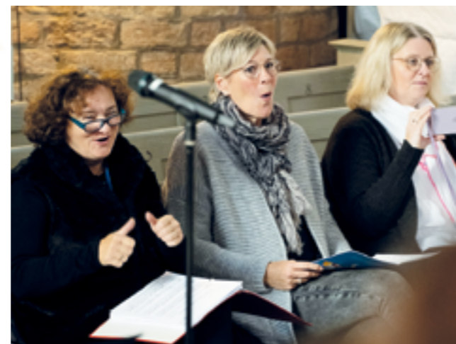
Die Musiklehrerinnen begeisterten die Kinder für das Projekt

raum! Den sollen unsere Stimmen ausfüllen? Und diese vielen leeren Bänke! Aber die gute Organisation ließ keine Zeit, darüber lange nachzudenken: der