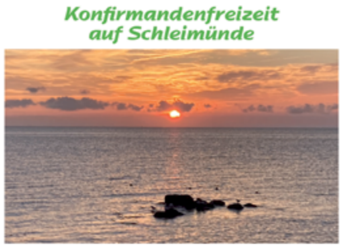
Tägliches großes Natur-Kino