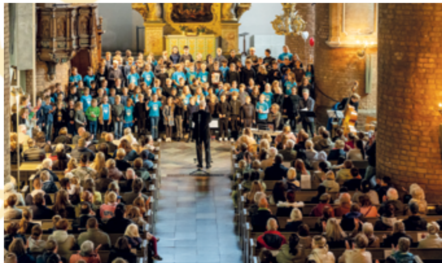
Dritte und vierte Klassen in Aktion