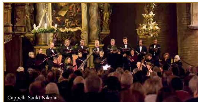
Cappella Sankt Nikolai