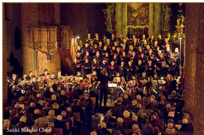
Sankt Nikolai Chor